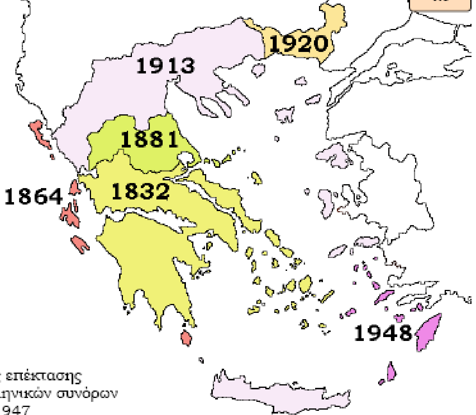
Χάρτης επέκτασης των ελληνικών συνόρων 1832-1947