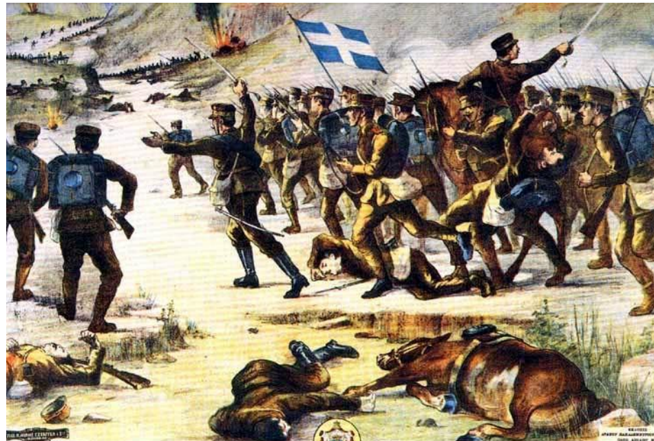
ΕΚ ΤΟΥ ΕΛΛΗΝΟΤΟΥΡΚΙΚΟΥ ΠΟΛΕΜΟΥ ΤΟΥ 1912 Η ΜΕΓΑΛΗ ΜΑΧΗ ΤΟΥ ΓΥΡΙΝΟΥ ΚΑΙ Η ΕΞ ΕΠΙΘΕΣΗΣ ΚΑΤΑΛΗΨΗ ΑΥΤΟΥ ΤΗ 6 ΟΚΤΩΒΡΙΟΥ