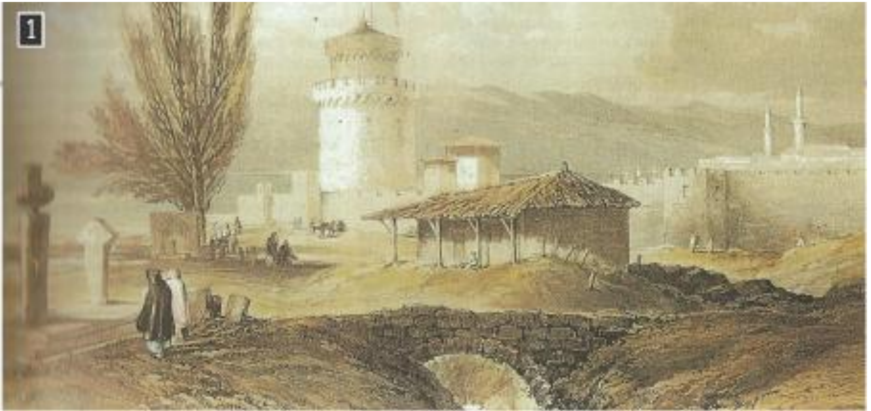
Ο Λευκός Πύργος στη Θεσσαλονίκη, χαρακτικό του 19ου αιώνα, Αθήνα, Γεννάδειος Βιβλιοθήκη