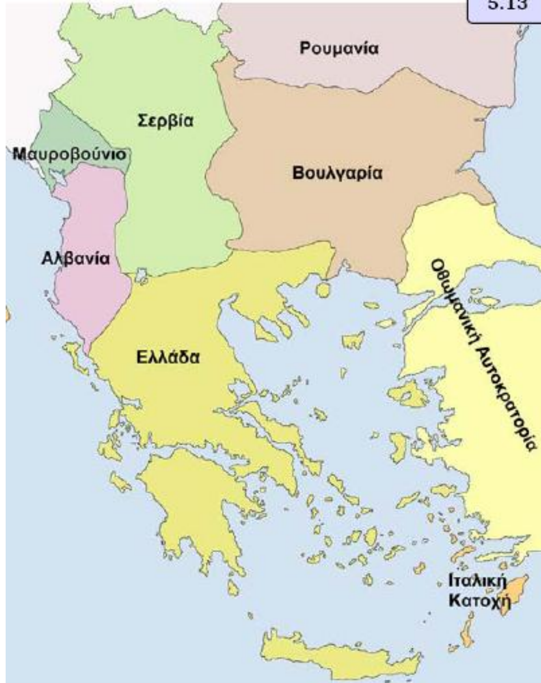
Χάρτης των Βαλκανικών κρατών, σύμφωνα με τη Συνθήκη του Βουκουρεστίου (1913)