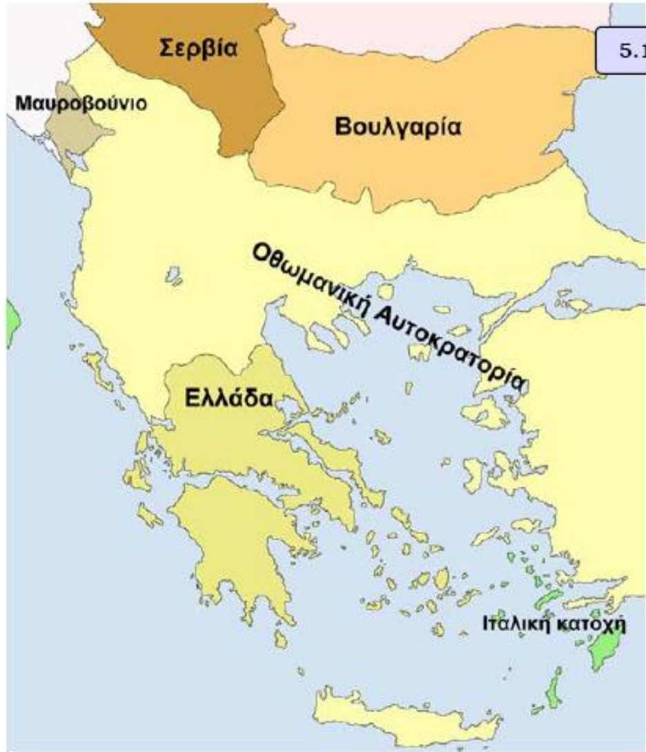
Χάρτης των Βαλκανικών κρατών πριν την έναρξη των Βαλκανικών πολέμων